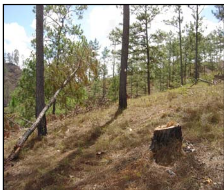
POA: Y-1-230-2006: Se observa la marcación de árboles semilleros

Árboles semilleros: Se observó en los tres planes operativos, cabe destacar que en el plan operativo Y-1-230-2006, de acuerdo al expediente el tratamiento para las tres unidades de corte es el método silvicultural corte selectivo; no obstante en campo se observó la marcación de corte con semilleros