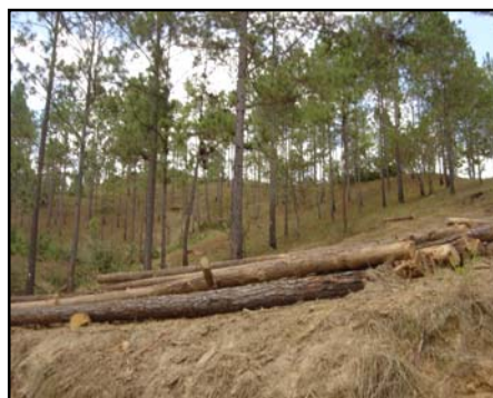
POA: Y-1-233-2007: Se observa el inicio de las actividades de aprovechamiento

Cabe señalar que en el plan operativo Y-1-233-2007, se observaron árboles marcados para corte y como semilleros fuera de los límites; por lo tanto estas marcas (puntos azules y blancos) deberán ser borrados para evitar confusiones, y a la vez asegurar la protección de la fuente de agua.