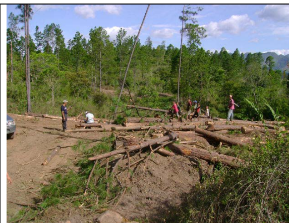
Imagen 2 Vista parcial del aprovechamiento ilegal en el sitio Las Palmas

Además encontraron dos maquinas, una cargadora frente a una casa vecina cerca del área de corte y un tractor que estaba en operaciones y recién lo apagaron antes de huir del lugar, ya que el motor se encontraba caliente aun. El tractor abandonado en un tractor marca Caterpillar, motor 5S677-26, RRM Marca Registrada 3967291. Ver imágenes No. 3 y 4.