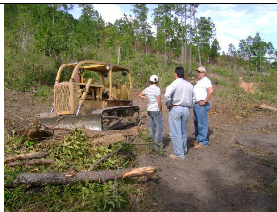
Imagen 4 Fotografía del tractor encontrado por la comisión en el sitio Las Palmas

Para incentivar la localización de este tractor la AFE-COHDEFOR está ofreciendo recompensa por quien brinde información cierta sobre el paradero de este tractor. Ver anexo No. 2.