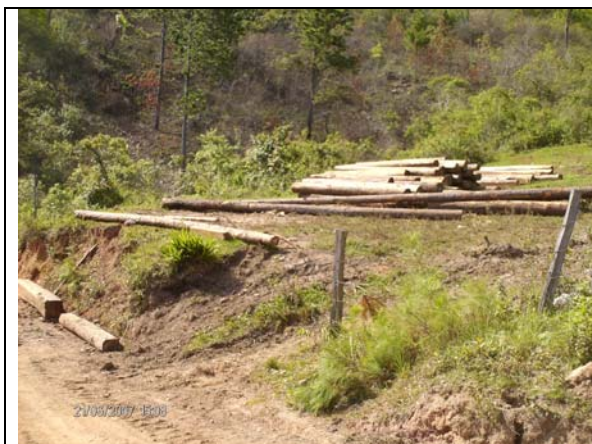
Imagen 1 Fotografía de la madera abandonada en la bacadilla en el sitio Las Palmas

Encontrándose, encontraron varias trozas de madera de pino cortadas y puestas en bacadilla. Ver imágenes No. 1 y 2.