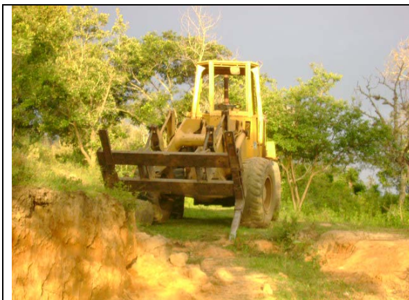
Imagen 3 Fotografía de la cargadora encontrada por la comisión en el sitio Las Palmas