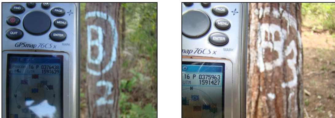
Figura 4. Marcación de las bacadillas y verificación de la ubicación de las mismas en ambos POA`s

Las bacadillas son áreas de acopio de la madera en rollo ubicadas en las unidades de corte. Durante la inspección a los dos POA`s en mención, dichas áreas fueron escogidas y marcadas siguiendo la normativa establecida.