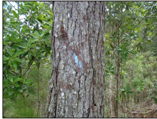
Figura 2. Marca en el troco del árbol a la altura del Pecho (1.30 m). CONADEH. 2014