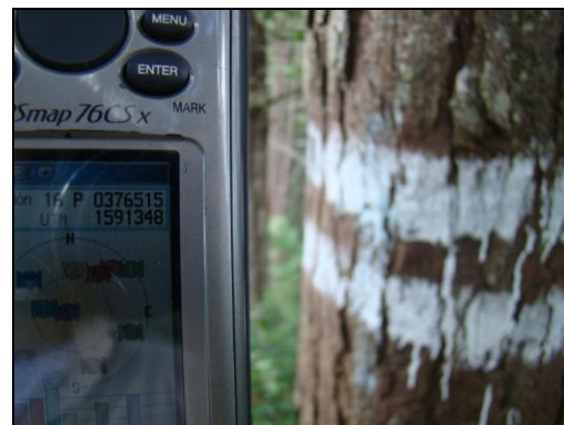
Figura 3. Árboles límite del plan de manejo y de las unidades de corte. CONADEH. 2014