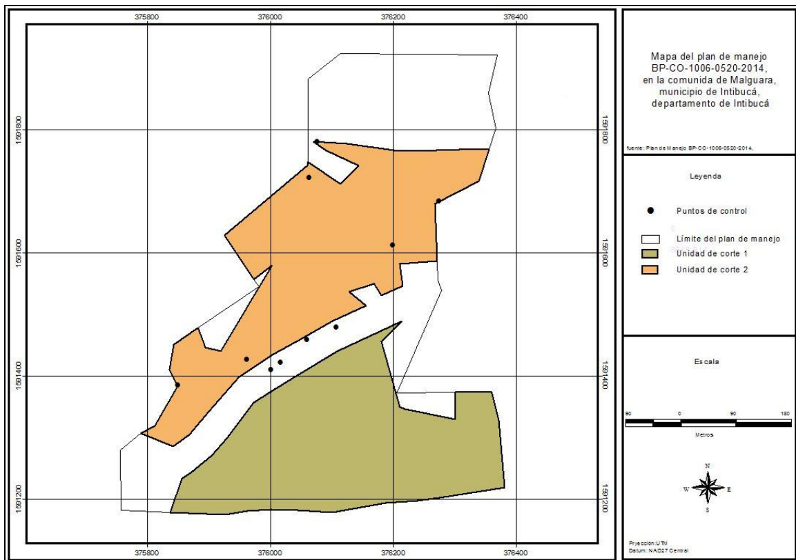
Mapa 2. Ubicación del POA CO-0520-001-00664-2014 sitio Malguara, Intibucá, Intibucá 7