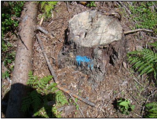
Figura 1. La marca al pie del árbol permanece aun después de cortado. CONADEH. 2014