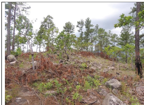
Imagen 9. En el área de aprovechamiento se observó presencia de residuos de este, los cuales deben ser tratados previo a la emisión del finiquito correspondiente. La Paz. MFI, 2024

Durante la inspección de campo, se pudo constatar que el tratamiento de desperdicios del aprovechamiento aún no ha sido realizado. Sin embargo, esta inspección coincidió con una supervisión rutinaria de ICF y en ella se brindaron recomendaciones al Técnico Forestal Calificado responsable de la administración del POA, para el cumplimiento del picado y esparcido de los desperdicios y en algunos sitios también apilado de desperdicios que representan un riesgo en temporada de incendios forestales.