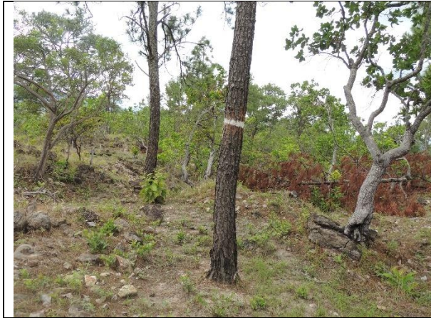
Imagen 7. Marcación de límites de POA conforme a normativa técnica, en el sitio Lagunetas. La Paz. MFI, 2024

Se realizó un recorrido para verificar los límites del plan operativo, encontrando que la distancia existente entre los árboles límite es correcta y estos son visibles fácilmente uno del otro.