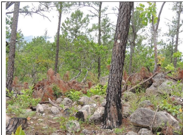
Imagen 2. Árbol semillero, fácilmente identificado en el sitio Lagunetas, por sus puntos blancos que lo identifican como tal. La Paz. MFI, 2024

Además, se observó que los árboles marcados cumplen con la normativa técnica específica para cada uno de ellos, es decir tienen las características correctas para cumplir sus funciones de semilleros o árboles de corte según prescripción técnica.