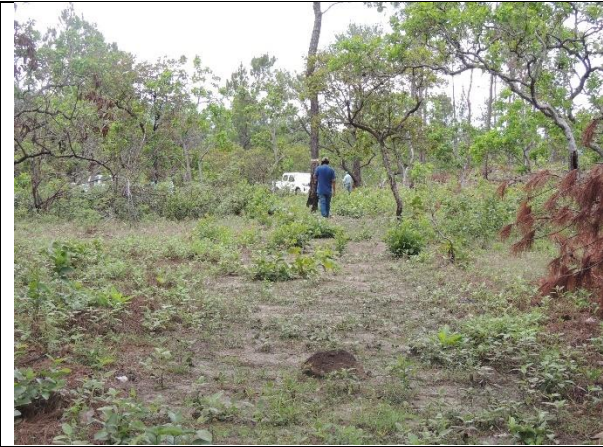
Imagen 8. Visibilidad de los límites del POA entre uno y otro fácilmente localizable, sitio Lagunetas. La Paz. MFI, 2024