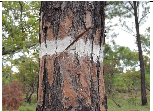
Imagen 3. Marcación de límite, utilizando anillo de color blanco, tal como lo exige la normativa técnica de los límites de unidades de corte. La Paz. MFI, 2024