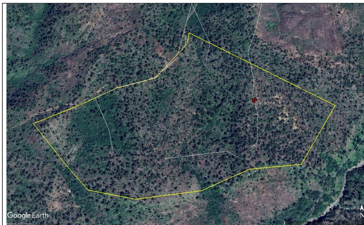
Imagen 6. Ubicación verificada de bacadilla N0. 3 con la coordenada x: 427878. Y.1555660. Fuente: Google Earth, junio 2024.

Las bacadillas son áreas definidas dentro de un POA para el acopio temporal de madera en rollo ubicadas en las unidades de corte. En el caso del POA No. CO-0712-001-00909-2023, se pudo verificar la ubicación de la bacadilla No. 3 de la unidad de corte, misma que se encuentra ubicada correctamente.