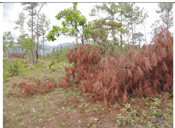
Imagen 10. Evidencia de las ramas de árboles que aún no han sido picadas y esparcidas en el área de la unidad de corte. La Paz. MFI, 2024